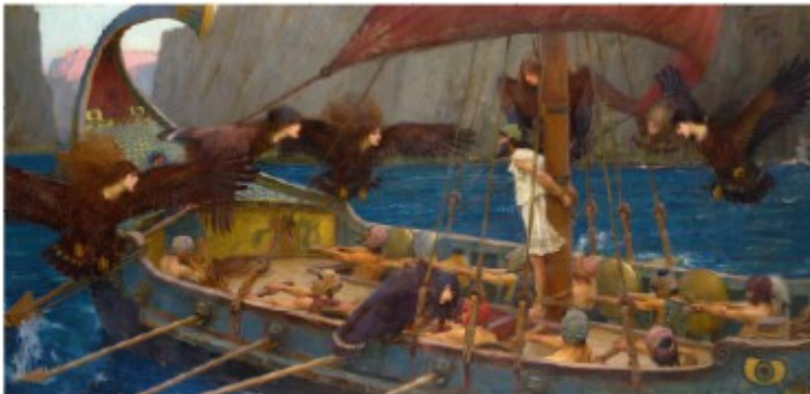
Ulysse et les sirènes.