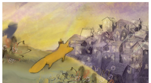
« La reine des renardes »