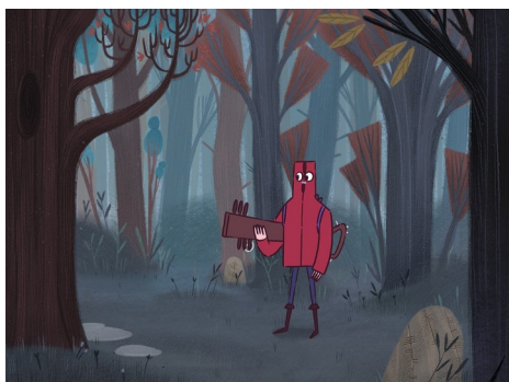
« Mélodie des bois »