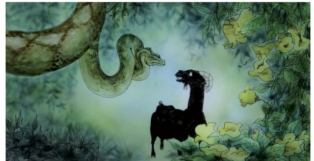
« Colocation sauvage »